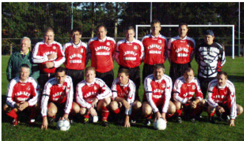
Equipe vétérans 2002-2003